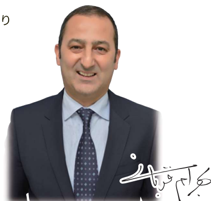
株式会社アルキューブ 代表取締役会長兼社長

私たちは、お客様の声に寄り添いながら、これからも誠実な姿勢で、お客様や社会に貢献できる企業として躍進してまいります。